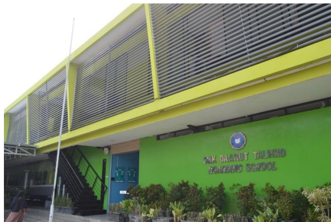
Gambar 1. SMK Daarut Tauhiid Boarding School Bandung

Namun, setelah para siswa lulus, sekolah merasa kesulitan untuk melacak alumni seperti informasi alumni yang bekerja, melanjutkan dan berwirausaha. Hal ini dapat menghambat upaya sekolah dalam meningkatkan kualitas pendidikan serta memperoleh umpan balik yang berguna untuk perbaikan.