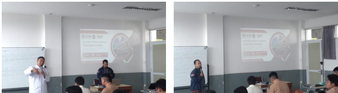
Gambar 3. Kegiatan Sosialisasi Tracer Study kepada Calon Alumni

Sebagai hasil dari sosialisasi ini, calon alumni mengalami peningkatan kesadaran terhadap peran Tracer Study dalam membantu mereka mengidentifikasi peluang karier, memahami pasar kerja, dan mengembangkan rencana karier yang lebih terarah. Mereka juga merasa lebih terhubung dengan sekolah mereka, merasakan dukungan yang lebih kuat dari lembaga pendidikan, dan semakin siap untuk melangkah ke dunia kerja.