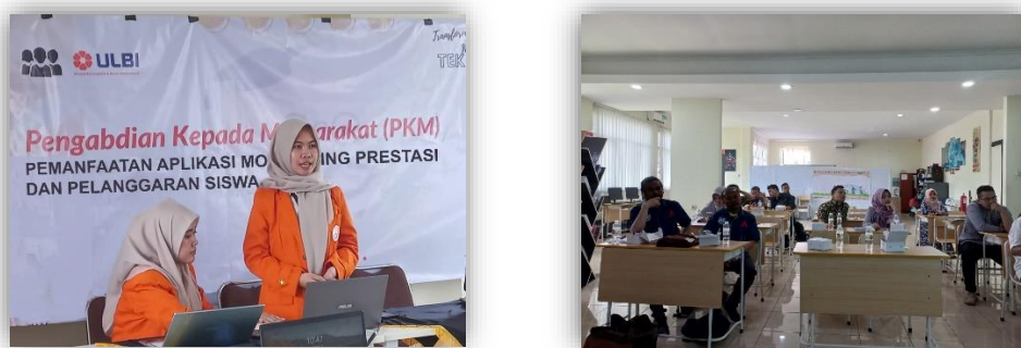
Gambar 1. Dokumentasi Pelatihan kepada Guru dan Staff

Dalam pelaksanaan Pengabdian Kepada Masyarakat (PKM), kami berhasil mencapai peningkatan pemahaman yang signifikan di antara guru dan staf pendidikan. Peningkatan ini meliputi pemahaman yang mendalam tentang penggunaan aplikasi monitoring prestasi dan pelanggaran siswa. Peningkatan pemahaman ini tidak sekadar perubahan sekilas, melainkan perubahan yang mendalam dalam pandangan mereka terhadap teknologi dan pentingnya data.