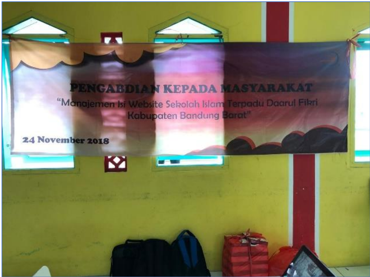
Gambar 2. Spanduk Kegiatan