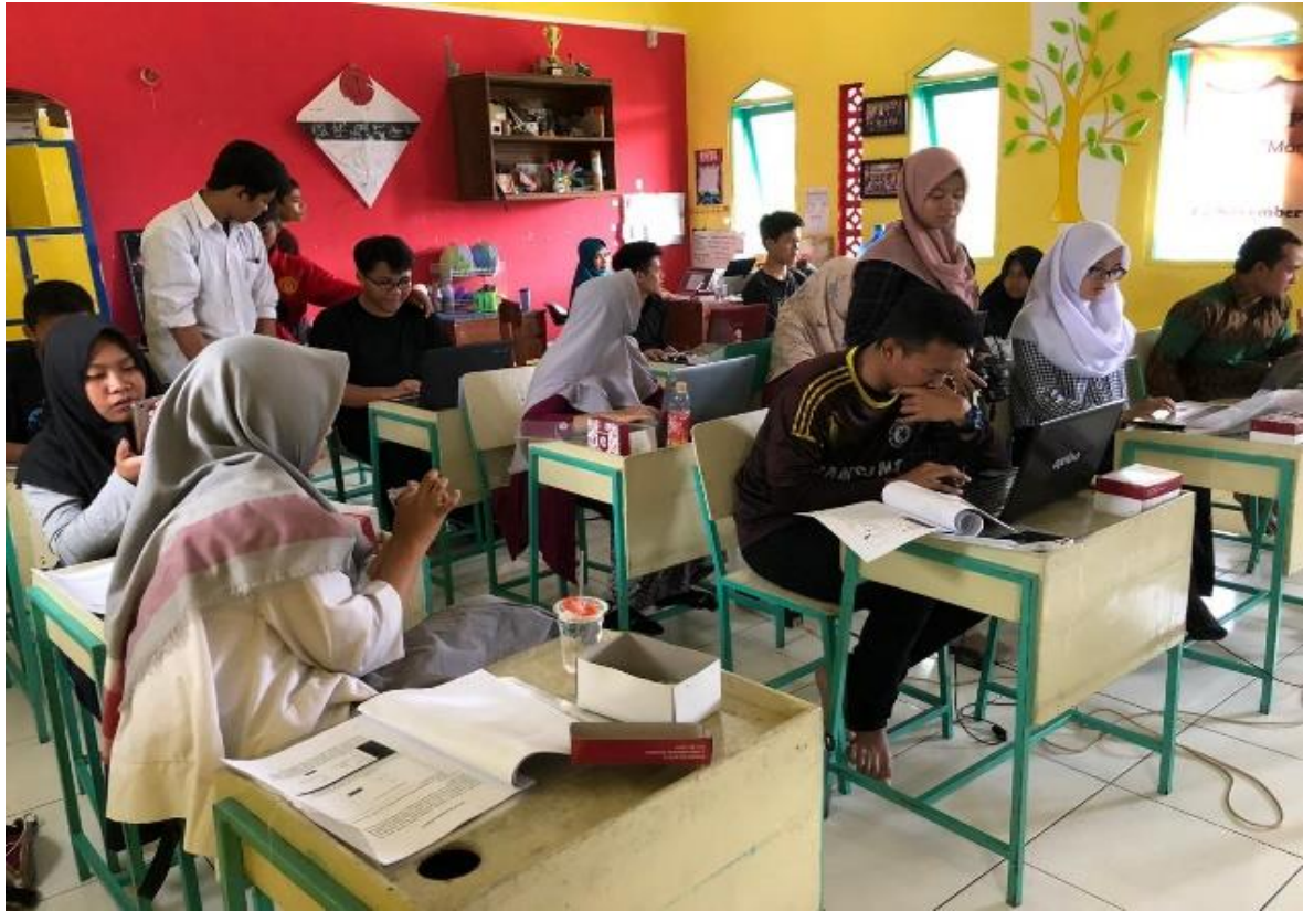
Gambar 3. Kegiatan Pelatihan