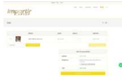
Gambar 12 tampilan antarmuka laman cart

Gambar diatas adalah tampilan halaman cart atau keranjang. Halaman cart adalah halaman yang berfungsi untuk menampilkan data pembelian pengguna sebelum menuju pembayaran/ checkout . Pengguna bisa menambah, mengurangi dan menambah produk yang berada dalam keranjang belanja.