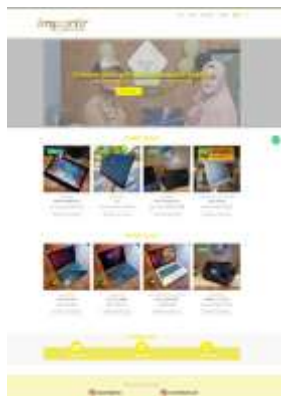
Gambar 10 tampilan antarmuka laman home

Halaman ini merupakan tampilan yang akan di lihat pertama kali oleh pengguna Ketika memasuki website toko online, yang kemudian tersedia menu di header, dan button yang Ketika di klik akan menuju laman yang di tuju