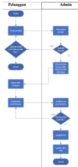
Gambar 2 Sistem yang berjalan

Sistem yang masih berjalan saat ini, masih menggunakan cara konsumen menanyakan stok produk kemudian penjual mengecek jika barang masih ada konsumen akan transfer atau melakukan transaksi di toko untuk melakukan pembayaran dan mendapatkan produk.