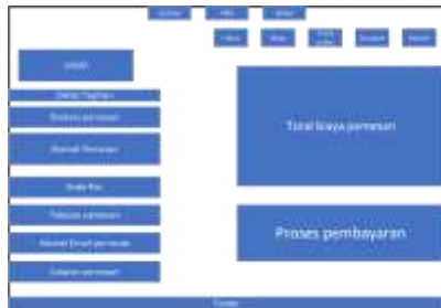
Gambar 9 tampilan desain halaman checkout