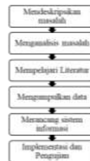
Gambar 1 kerangka kerja perancangan

Dalam penyusunan laporan ini penulis akan memberikan gambaran Langkah langkah yang mencakup dari awal penelitian sampai dengan akhir penelitian, Kerangka kerja dalam penelitian ini dijelaskan pada gambar sebagai berikut.