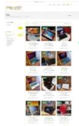
Gambar 11 tampilan antarmuka laman shop

Halaman ini merupakan tampilan yang akan di lihat pertama kali oleh pengguna Ketika memasuki website toko online, yang kemudian tersedia menu di header, dan button yang Ketika di klik akan menuju laman yang di tuju