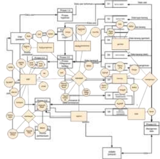
Gambar 4 Data flow Diagram 0