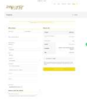
Gambar 13 tampilan antarmuka laman checkout

Halaman ini menampilkan data yang harus di isi oleh pembeli yang terdiri dari profil