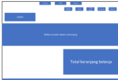
Gambar 8 tampilan desain halaman cart