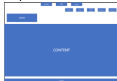
Gambar 6 tampilan desain halaman home