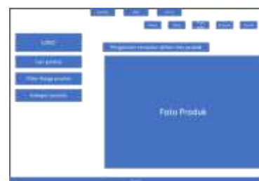
Gambar 7 tampilan desain halaman shop